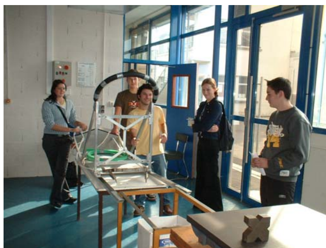
Rencontre autours du traîneau fabriqué par la promo. précédente.